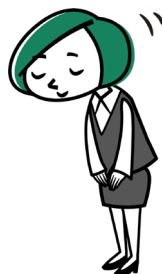
manaable公式キャラクター マナちゃん

新潟県社会福祉士会では、受講者の利便性向上を目的に、2025年9月より研修管理システム「manaable（マナブル）」を導入しました。